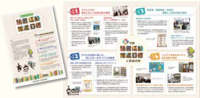
第二次港北区読書活動推進目標リーフレット