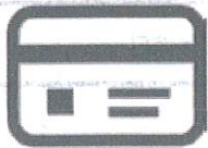
キャッシュカード