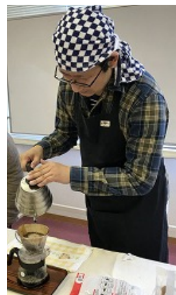
おいしいコーヒーを淹れています

世代を超えて、人と人がつながる関係づくりや、地域の支えあいの仕組みを広めたい。住みやすく、暮らしやすい戸塚を目指しています