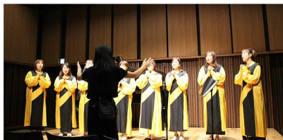
【Agape Fellowship Choirさん】