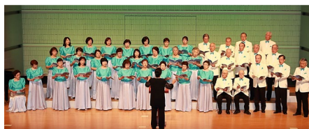
【混声合唱団ヴァンティアン瀬谷さん】