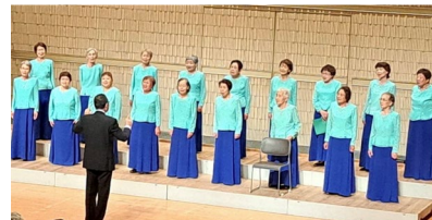
【せやあじさいコーラスさん】