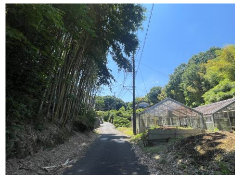
ツアーの中盤、果樹や野菜の農園地帯がある新吉田の奥深く、なんだか遠くへ来てしまったような風景が続きます

コース：高田駅→早淵川→浄泉寺→円応寺→新吉田杉山神社→森農園→果樹畑などが広がる一带→竹藪の脇を抜け→北新羽が見渡せる坂道→新羽新吉田せせらぎ緑道→新羽杉山神社→西方寺（行程：約4.8キロ、12時頃解散予定）