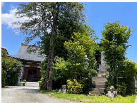
高田駅から歩き始めて間もなく、梨農園が並んだ一带に、可愛い石像がたくさん置かれている浄泉寺があります

幹線道路から裏道に入り丘陵地帯へ。果実や野菜を作る農園や木々が生い茂る緑豊かな風景が広がります。ここが横浜？って思うような光景も。道端の草木を楽しみながら、この地域の歴史と文化に思いを馳せる旅。あなたもでかけてみませんか。