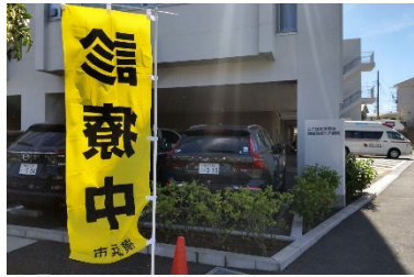
よこはま港南台地域包括ケア病院