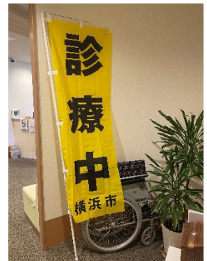
芹が谷整形外科クリニック