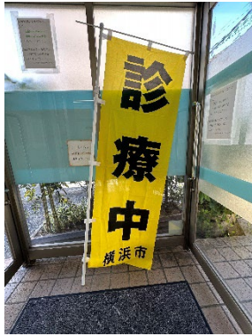
みながわ泌尿器科クリニック