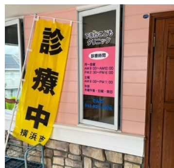
下永谷こどもクリニック