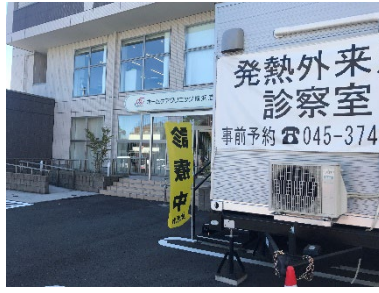
ホームケアクリニック横浜港南