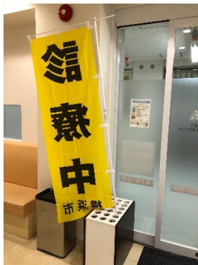
港南台レディースクリニック