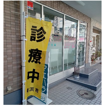
マエハラ歯科医院