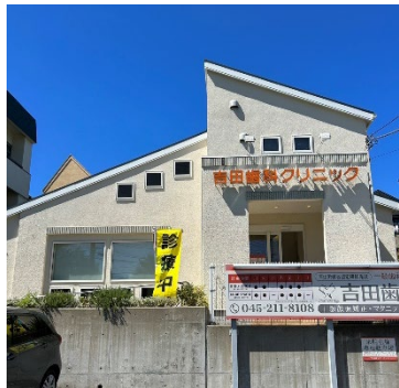
吉田歯科クリニック