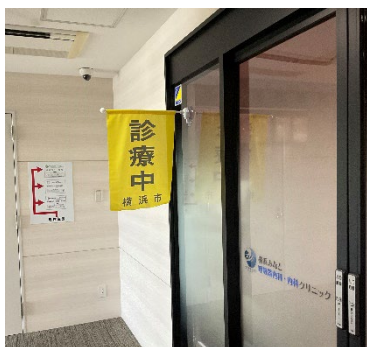
横浜みなと呼吸器内科・内科クリニック