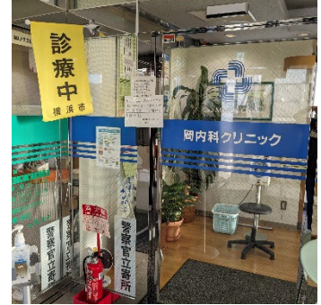
岡内科クリニック