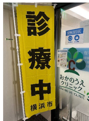
おかのうえクリニック