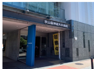
秋山脳神経外科病院