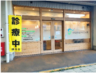
つながるクリニック