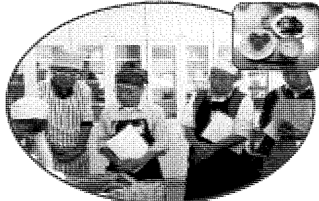
土曜は男のキッチン