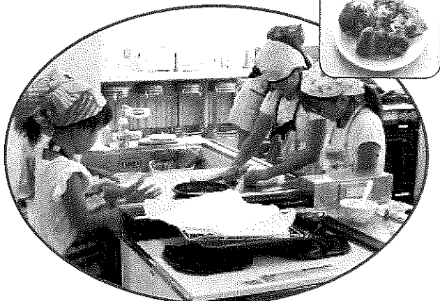
楽しく成形パン教室