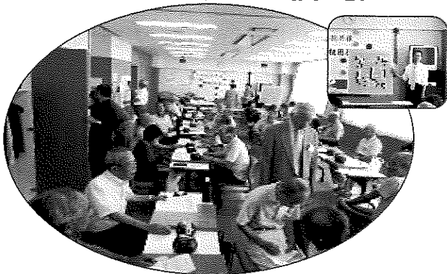
日本棋院共催 懇親囲碁大会