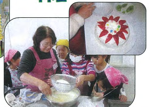
クリスマスケーキ作り