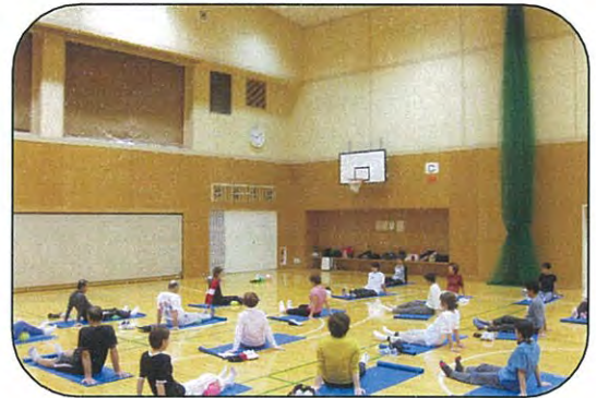
筋トレ&ストレッチ