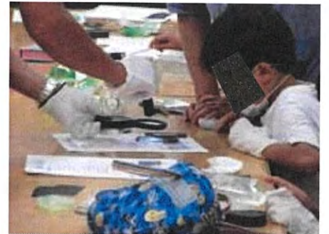
7月 こども鑑識係「指紋とルミノール反応」