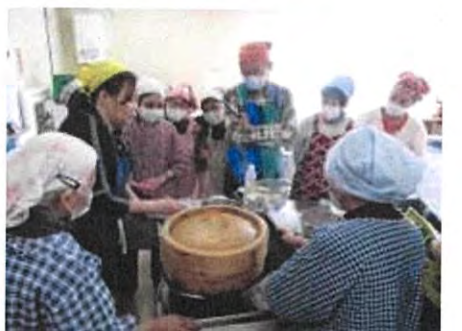
2月 世界の家庭から「中華」