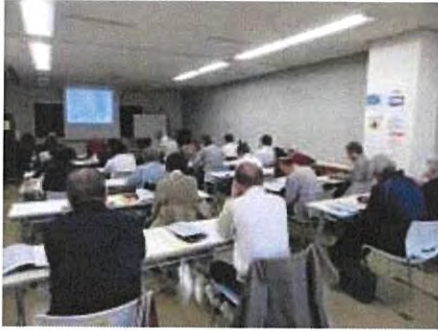
4-6月 古文書で学ぶ「東南海トラフ巨大地震」