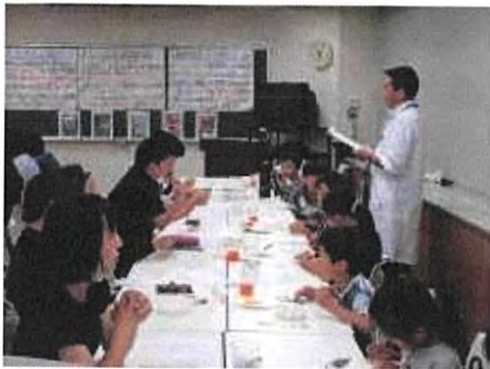
7月 人エイクラを作ろう