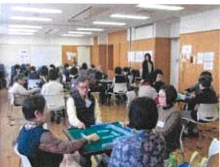
12-1月 3館合同マージャン大会