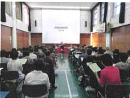
11月 音楽と落語の宅配便