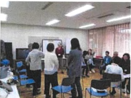
11-12月 お・も・て・な・し英会話