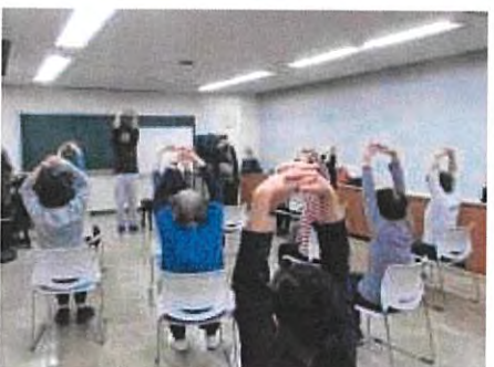
2月 頑張らないストレッチ