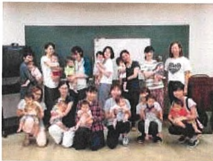
9月 ママとベビーの「ストレッチ・ヨガ」