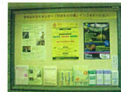
京急上大岡駅内 専用アドボード