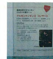
京急グループ広報紙 なぎさ