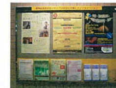
バスターミナル内 専用アドボード