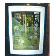
施設内 内照式ポスターケース