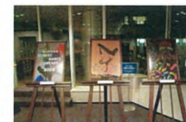
KSDC 高校生ポスターコンテスト