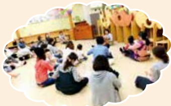
▲親子で過ごせる居場所があります(にこりんく)

さまざまな子育て情報が入手できる情報コーナーを設置しているほか、多様な媒体で情報を発信しています。