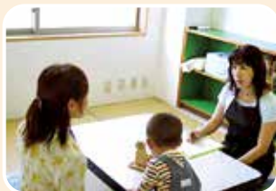
▲ゆっくりお話を伺えるお部屋があります(どろっぶ)