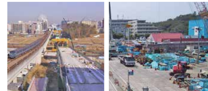
▲建設当時のセンター南駅