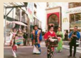
▲グリーンライン開業時に商店街で行われたイベント