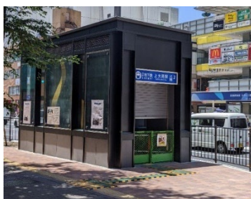
上大岡駅（出口付近）