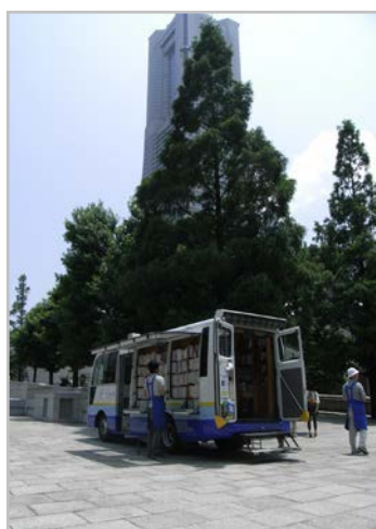
みなとみらい駐車場