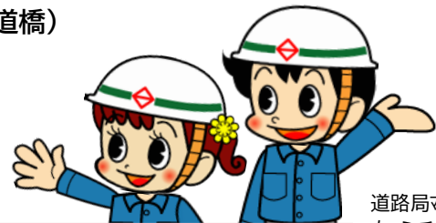
道路局マスコットキャラクター 左:ミチルちゃん 右:ミチローくん