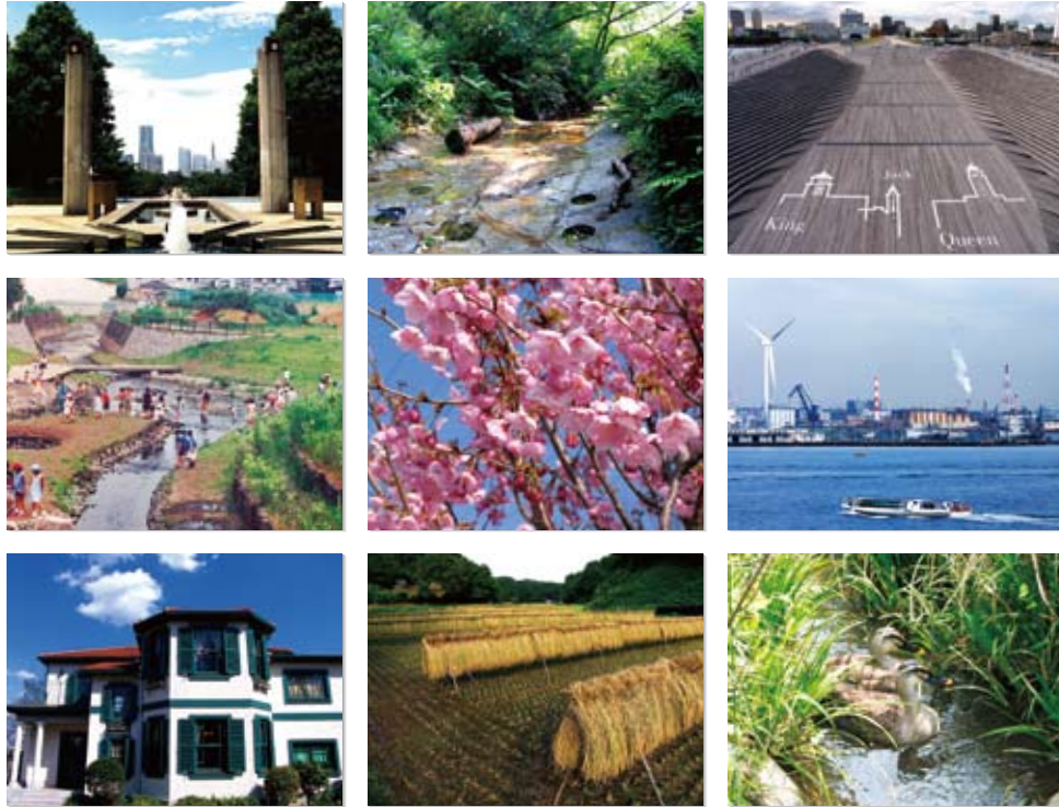
上段左/山下公園(市民活力推進局広報課提供) 上段中/永取沢市民の森(市民活力推進局広報課提供) 上段右/大棧橋(市民活力推進局広報課提供) 中段左/梅田川(環境創造局提供) 中段中/ヨコハマヒザクラ(市民活力推進局広報課提供) 中段右/ハマウイング(市民活力推進局広報課提供) 下段左/プラハ18番館(市民活力推進局広報課提供) 下段中/寺家ふるさと村(市民活力推進局広報課提供) 下段右/舞岡町小川アメニティ(環境創造局提供)