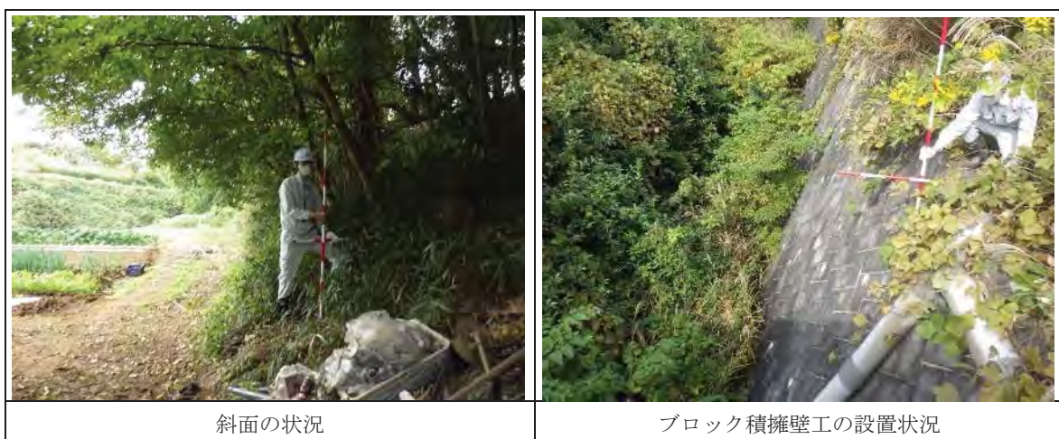
写真9.8-1 土砂災害警戒区域の状況