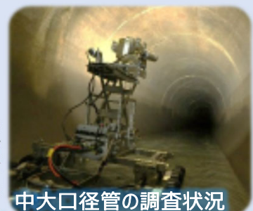
中大口径管の調査状況 ① 予防保全型維持管の強化

下水道管の清掃を兼ねたスクリーニング調査は目標を上回りました。また、中大口径管の維持管理について、新たに包括的民間委託を導入する等、予防保全型維持管理の強化を図りました。下水道管の再整備は、管更生工法を主体とした再整備に変更することで目標を上回りました。一方、水再生センターの主要設備及び土木施設の再整備は、新型コロナウイルス感染症等の影響により工事進捗が遅れました。