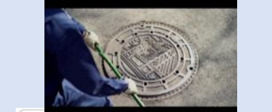
下水道のPR動画とマンホールカード ② 環境教育を通じた環境行動の促進と下水道のイメージアップ

【順調】 新型コロナウイルス感染症の影響により活動が制限された中で、遠隔コミュニケーションツールを活用しながら効果的に海外展開支援を進めました。また、マンホールカードの配布や高校生を対象にした下水道マニアの実施、SNS等の媒体を利用した下水道のPR動画による広報活動等、幅広い世代への情報発信を実施しました。