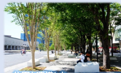
公園と連携した保水・浸透機能を高める取組 ③ グリーンインフラの活用

【順調】 下水道普及率は2019年度末に概成100%となりました。また、雨水貯留浸透施設の設置助成について遅れが出ましたが、グリーンインフラの活用については市営住宅の建替事業と連携した取組を開始するなど、新たな主体との連携を進めました。