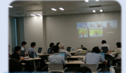
海外事業者とのオンライン会議 ③ 下水道に関する最先端の知見の収集・蓄積と国内外への発信

【順調】 新型コロナウイルス感染症の影響により活動が制限された中で、オンライン会議などの遠隔コミュニケーションツールを活用しながら、国内外における新技術等に関する情報収集を実施しました。