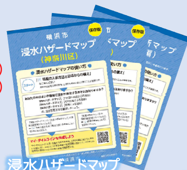
浸水ハザードマップ (神奈川区、金沢区、栄区) ② 自助・共助の促進支援

【順調】 地震対策について、地域防災拠点の流末枝線下水道や幹線下水道の耐震化は目標を上回りました。浸水対策については、横浜駅周辺地区の浸水安全度向上に向けて、新たな雨水幹線の立坑工事に着手しました。また、関係部署と連携し、内水・洪水・高潮の各ハザードマップを1冊にまとめた「浸水ハザードマップ」を新たに作成し、一部の行政区に配布を完了しました。