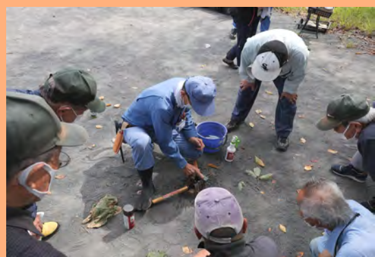
道具の手入れ方法も伝授！