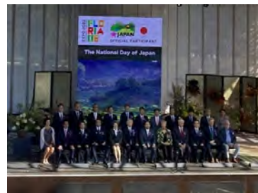
ジャパンデーイベントの様子