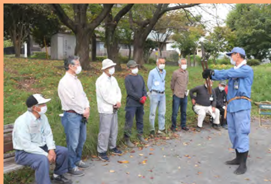
刈り込みに使用する道具の使い方を説明