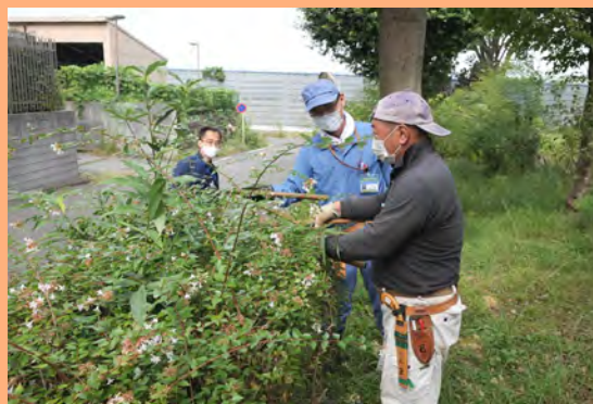
一緒に作業しながら、コツをつかめます！