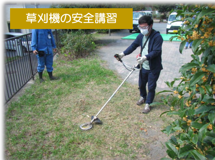
草刈機の安全講習

石飛びの少ない、比較的安全な2枚刃の草刈機（カルマー）の安全な使い方や手入れの方法について講習します。この講習を受講すると、土木事務所から、カルマーの貸出を受けることができます。