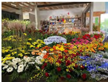
花で飾られた日本の屋内展示館

アルメーレ国際園芸博覧会の様子は、2027年国際園芸博覧会協会のホームページでも紹介していますので、ぜひご覧ください。