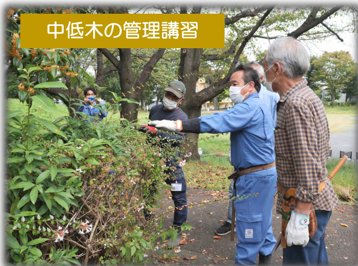
中低木の管理講習

中低木の刈り込みとせん定作業のコツを学びます。安全な作業方法、道具の手入れ方法についても講習します。樹木ごとの刈り込みの適期も知ることができます。