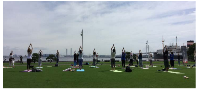
↑ 1回目の試行時の様子