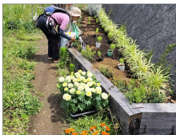
22 地域緑のまちづくり （中川西地区）