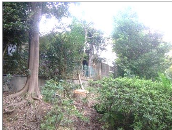
2 森の維持管理 （ゆうばえのみち）