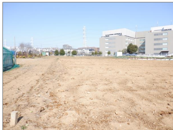
11 遊休農地の復元支援 （東方町）