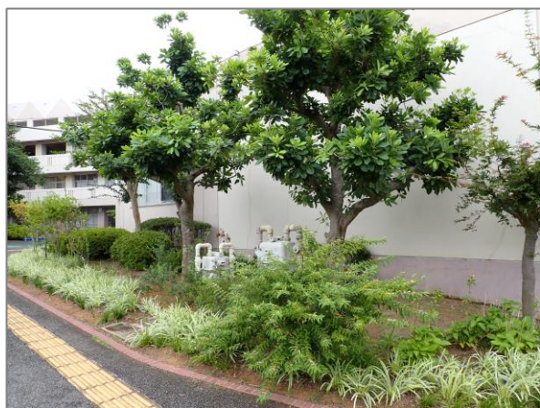
17 公共施設・公有地での緑の創出・育成 （つづきの丘小学校コミュニティハウス）