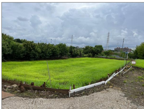
10 周辺環境に配慮した活動への支援 牧草等による環境対策（折本町）