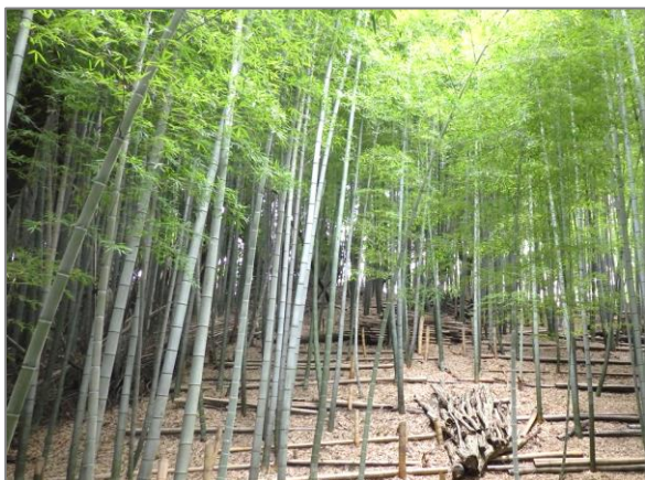
1 緑地保全制度による新規指定 源流の森保存地区（茅ヶ崎東五丁目）