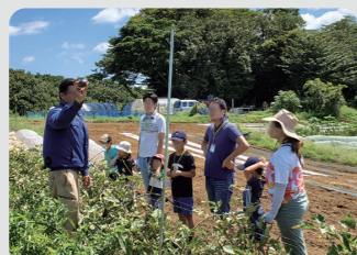
はまふうどコンシェルジュ活動支援 (保土ヶ谷区)