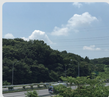
長津田町長月特別緑地保全地区(緑区)