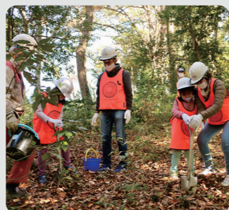
森づくり体験会(緑区)