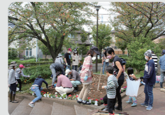
花壇の寄せ植えイベント(青葉区)