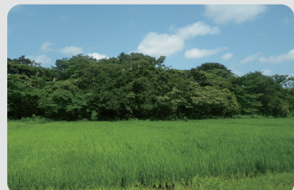
保全された水田(瀬谷区)