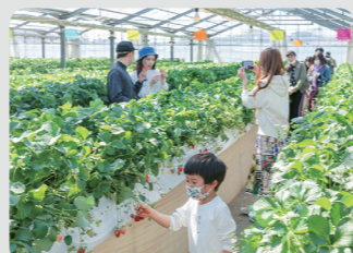
収穫体験農園(神奈川区)