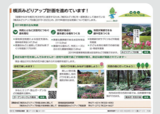
広報よこはまへの取組実績の記事掲載