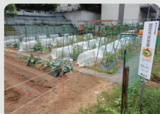
認定市民菜園(青葉区)