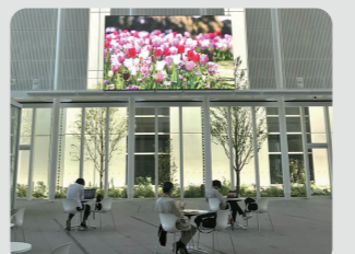
横浜市役所アトリウムでの動画放映