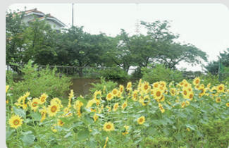
農地縁辺部への植栽(泉区)