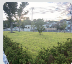
公共施設等での緑の創出 (市立脳卒中・神経脊椎 センター/磯子区)