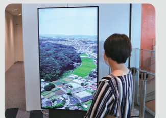
市庁舎デジタルサイネージでの動画放映