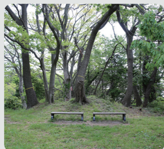
維持管理を実施した樹林地 (称名寺市民の森/金沢区)