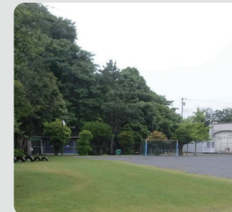
小学校での緑の創出・育成(栄区)