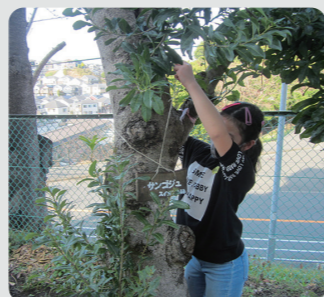
間伐材を活用した樹名板の取付け(南区)