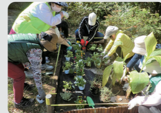
地域緑のまちづくり(港北区)