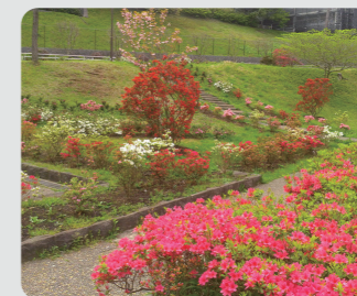
久良岐公園(港南区)