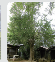
名木古木の指定 (鶴見区)