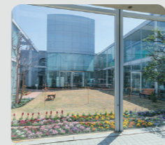
公共施設等での緑の創出 (下和泉地区センター/泉区)