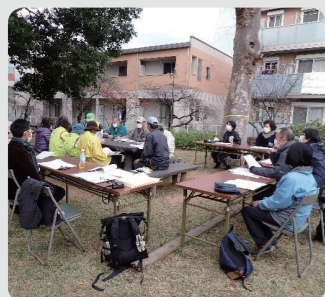
保全管理計画策定の様子 (上矢部ふれあいの樹林/戸塚区)