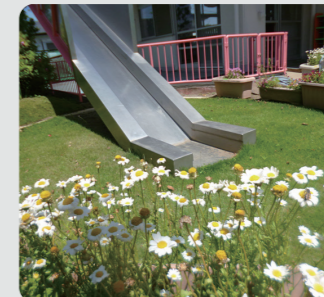
保育園での緑の創出・育成(旭区)