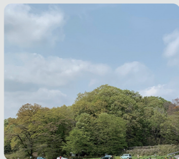
寺家町居谷戸特別緑地保全地区(青葉区)