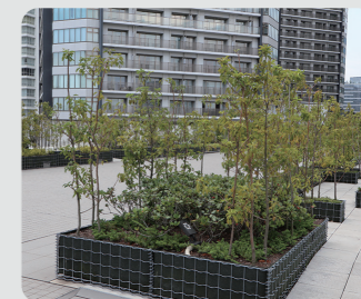
キングモール橋(西区)