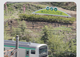
線路沿いでの現地表示看板の設置