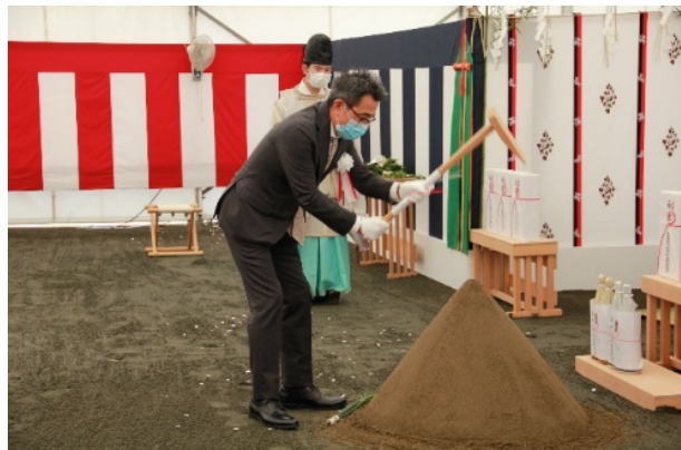
再開発組合池谷理事長による鍬入れ

日時：令和2年10月14日（水） 場所：港北区綱島東一丁目地区内（建設予定地） 斎主：綱島諏訪神社