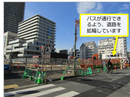
綱島84号線 新綱島駅北口～綱島街道(拡幅工事中)