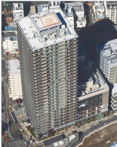
工事が完了した再開発ビル（新綱島スクエア）

10月20日に 新綱島駅前地区の再開発ビル（名称：新綱島スクエア）の建築工事が完了しました。 ビル内の商業施設は12月6日から順次開業、港北区民文化センター(ミズキーホール)は令和6年3月24日に開館し、新たなにぎわいの拠点が生まれます。