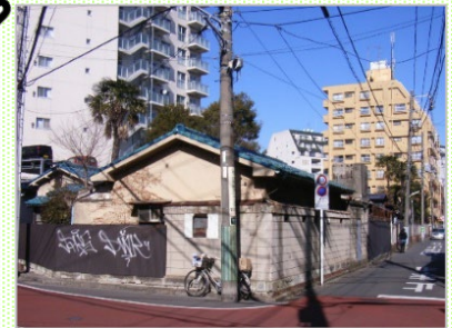
綱島日吉線から見た様子。旅館跡や住宅、駐車場がありました。