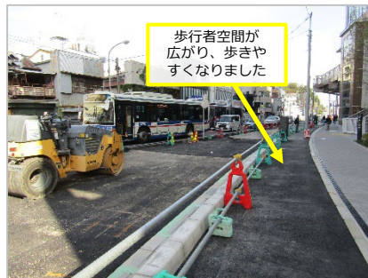
綱島街道(拡幅工事中)

綱島東線の開通に向け、周辺道路でも拡幅工事や歩道の整備を進めています。綱島街道や綱島84号線では、将来の道路形状が見えてきました。