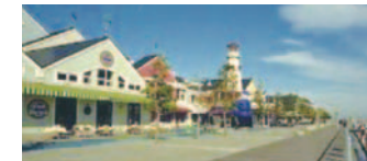
5 横浜ベイサイドマリナーシーボートレストラン、ファクトリーアウトレットと水際線プロムナード(金沢区)