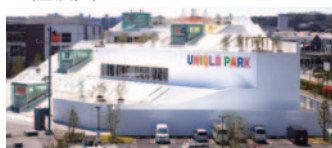
63 UNIQLO PARK 横浜ベイサイド店(金沢区)