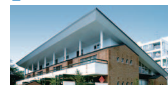
17 マーマシのはら保育園(港北区)