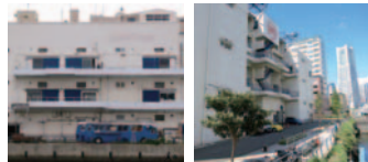
35 Bankart Studio NYK 万国橋SOKO (BANKART school)(中区)