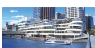
40 横浜ベイクォーター(神奈川区)