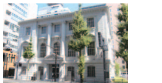
36 旧露亜銀行(ラバンクドロー)(中区)