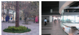
33 日産本社ビル通り抜け通路三井ビル公開空地(西区)