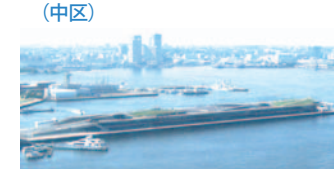
13 横浜港大さん橋国際客船ターミナル(中区)