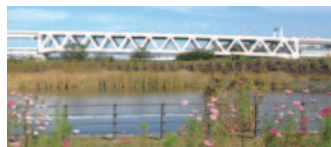
49 新横浜公園から見た大熊川トラス橋(港北区)