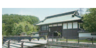
11 中丸家長屋門とその周辺(泉区)