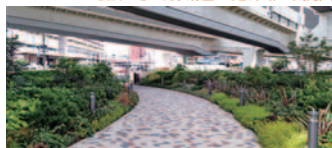
55 横浜北線及び岸谷生麦線高架下緑地~首都高高架下からキリンビール横浜工場へ続く緑豊かな散策路~(鶴見区)