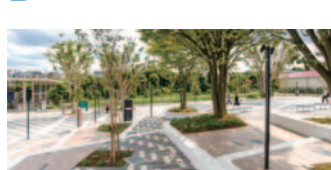
45 みなまき みんなのひろば(旭区)