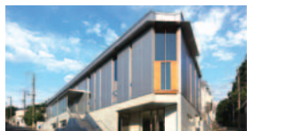
48 神奈川大学横浜キャンパス29号館(国際センター)(神奈川区)