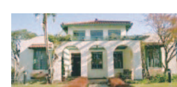
2 山手111番館とローズガーデン(中区)