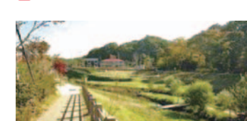
10 辺刈橋下流の水辺拠点(栄区)