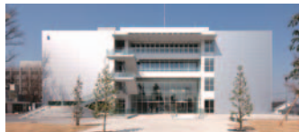
39 神奈川大学横浜キャンパス3号館(神奈川区)