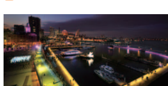
57 スマートイルミネーション(中区他)