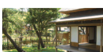
41 旧伊藤博文金沢別邸(金沢区)