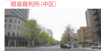
8 横浜情報文化センターと横浜地方・簡易裁判所(中区)