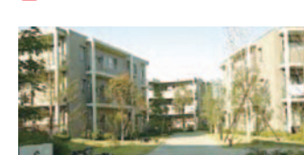
9 グランノア港北の丘(都筑区)