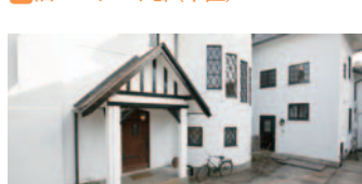
19 旧バーナード邸(中区)