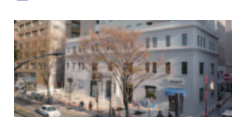
25 ストロングビル(中区)