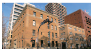
56 THE BAYS&中区役所別館(中区)