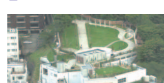
28 アメリカ山公園(中区)