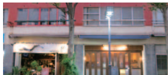
32 防火帯建築を活用した吉田町のまちなみ(中区)