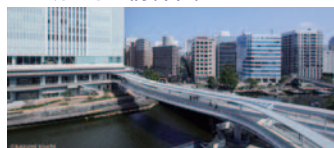
61 横浜市役所の水辺テラスとさくらみらい橋(中区)