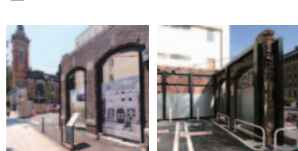
50 旧開通合名会社の煉瓦壁(中区)