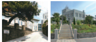
38 横浜地方気象台とプラフ99ガーデン(中区)