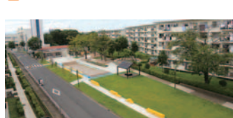
54 左近山みんなのいわ(旭区)