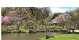
58 馬場花木園と旧藤本家住宅(鶴見区)