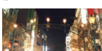
15 馬車道のガス灯(中区)