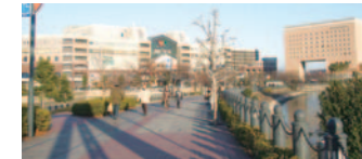
1 横浜ワールドポーターズ、ナビオス横浜と運河パーク(中区)