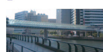
29 はまみらいウォーク(西区)