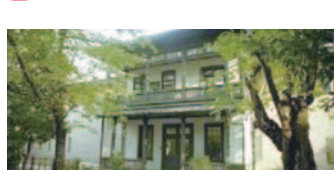
7 カトリック横浜司教会(中区)