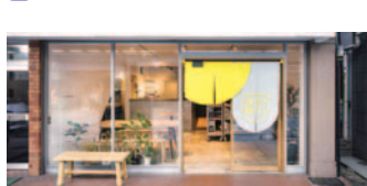
59 藤棚デパートメント(西区)