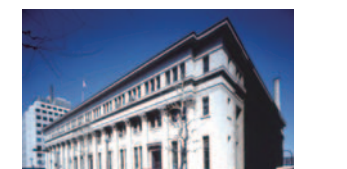
14 日本郵船歴史博物館(中区)