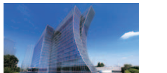
60 横浜ベイクート倶楽部ホテル&スパリゾート/ザ・カバ・ホテル&リゾート横浜(西区)