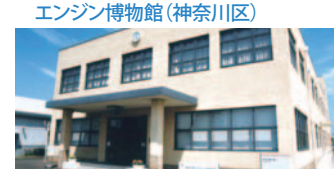
12 日産自動車横浜工場ゲストホール・エンジン博物館(神奈川区)