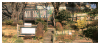
47 「夢の舞う岡」と命名されたまちなみの玄関(戸塚区)