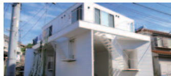
31 ヨコハマ・アパートメント(西区)