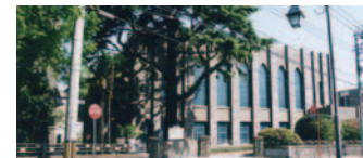
16 フェリス女学院中学校・高等学校1号館(中区)