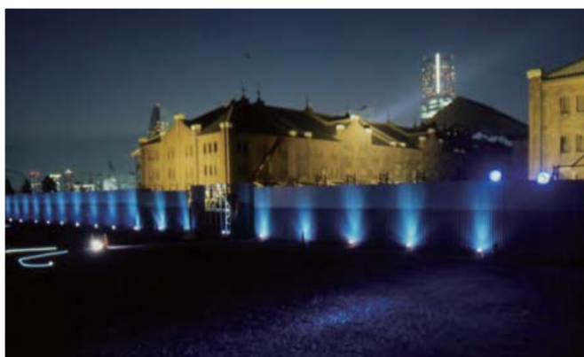
夜景演出照明実験 (1996・赤レンガパーク) ※