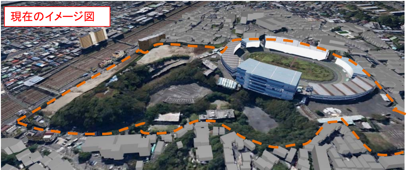
現在のイメージ図