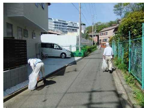
毎週月曜日の清掃活動

昨年の1年を通してスタンド等屋外施設の上物撤去が完了しました。建物基礎及び杭の撤去工事は昨年に引き続き継続しております。地域の皆さまには何かとご不便をおかけしますが、今年も何卒よろしくお願い申し上げます。