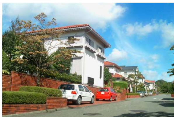
荏田北二丁目レンガ通り

このルールはレンガ通りに面する土地家屋その他の建造物、植栽等に適用される。レンガ通りの位置は、青葉荏田北二丁目地区地区計画に定める位置に同じとする。