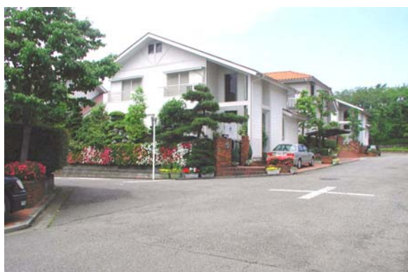
荇田北二丁目A地区

A地区の、統一感と調和をもち美しく個性のあるまちなみの維持向上をはかり、防犯性能の高い安全なまちとするため、共通ガイドラインに加えてA地区色彩ガイドラインを定める。