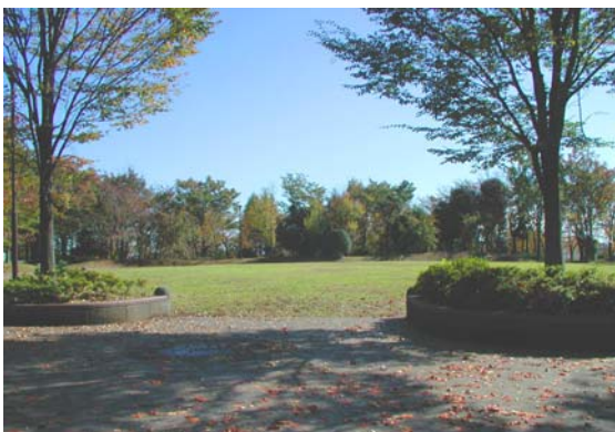
荻田北二丁目小黒公園