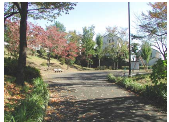
荻田北二丁目長谷第一公園