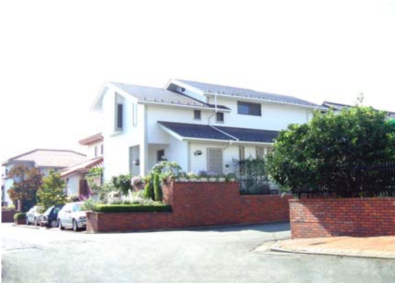
東急型北米様式(イングリッシュコンテンポラリー)