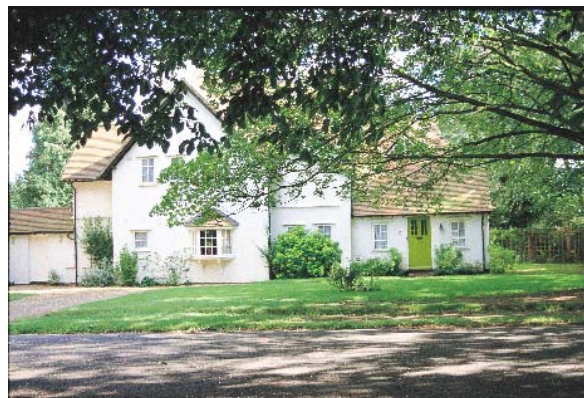
田園都市のまち レッチワース(ロンドン郊外)

田園都市線沿線は、1953年(昭和28年)策定の東急多摩田園都市構想にもとづいて、鉄道の敷設とまちづくりが進められてきた。東急多摩田園都市構想によるまちづくりは、1987年(昭和62年)度日本建築学会賞、2002年(平成14年)度日本都市計画学会賞を受賞している。