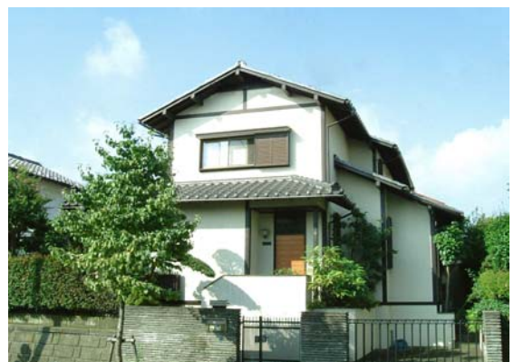
東急型真壁造様式