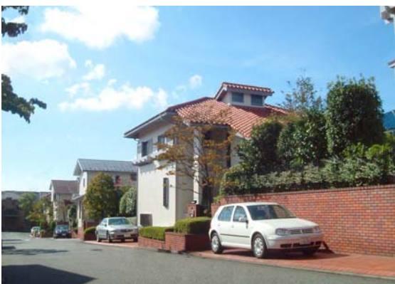
東急型北米様式(プロヴァンス)