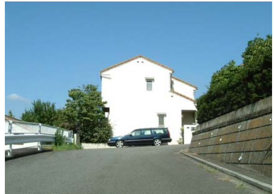
東急型北米様式(スパニッシュ)