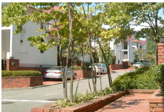
荇田北二丁目レンガ通り