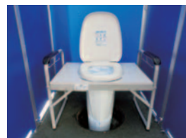
下水直結式仮設トイレ