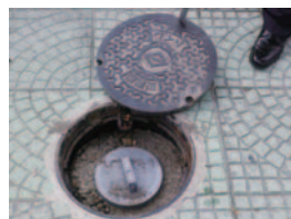
下水直結式仮設トイレ用マンホール

このトイレは水道が使用できない場合でも、プール等の水を活用してトイレの汚物を下水管へ流すことができます。