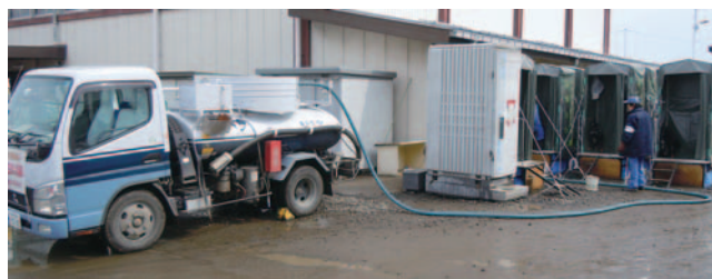
東日本大震災の被災地における災害復旧支援

災害時のし尿処理対策は衛生的、生理的な観点から、早急に対処すべき課題の1つです。地域防災拠点には多くの避難者が集まるため、設置された仮設トイレから衛生的かつ迅速にし尿を収集し、水再生センター等へ運搬する必要があります。北部事務所は、災害発生後2日目から順次くみ取りを開始します。