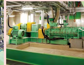
飛灰処理設備 二軸練機 Fly ash treatment system 2-shaft solidifier