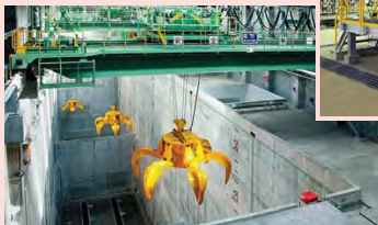
ごみピット/ごみクレーン Waste pit & Waste crane