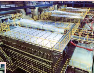
バグフィルタ Bag filter