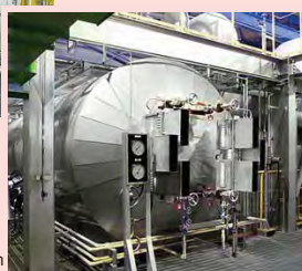
ボイラードラム Boiler drum