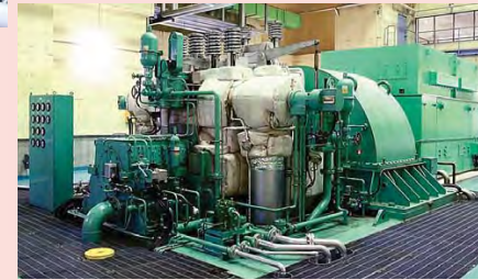
蒸気タービン発電機 Steam turbine generator