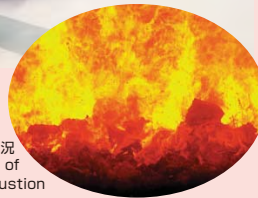
燃焼状況 State of combustion