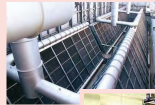
低圧蒸気コンデンサ Low-pressure steam condenser

Waste water... Below the wastewater standard value mandated by the Sewage System Law. Noise & vibration... Below the regulation standard mandated by the Noise Regulation Law and Vibration Regulation Law. Odor... Below the regulation standard value mandated by the Offensive Odor Control Law.