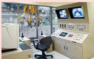
ごみクレーン操作室 Waste crane operating room