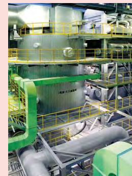
排ガス減温塔・エコノマイザ Exhaust gas cooling tower ・ Economizer