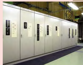
特別高圧受変電室 Special high-voltage power receiving room