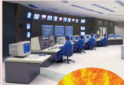
中央管制室 Central control room