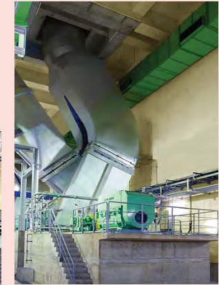
誘引通風機 Induced draft fan