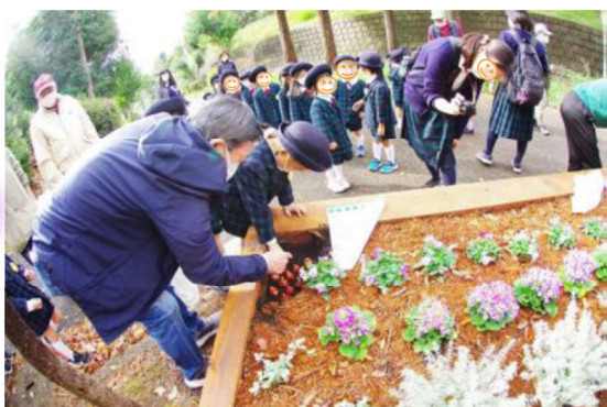
幼稚園児とオアシス交差点花壇の花苗植えの様子