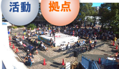
商店街プロレス令和5年9月17日