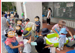
えんにちあそび 令和5年7月21日(金)