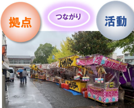
秋ふれあい祭り令和5年10月15日(日)