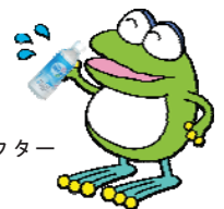
横浜市水道局キャラクター はまピョン