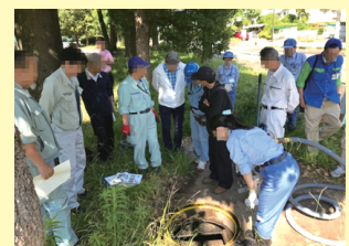
▲ 支援協力員、管工事協同組合、水道局での応急給水訓練の様子

令和5年度では約150名が登録されており、地域における応急給水訓練等に参加し、災害時の「共助」の取り組みに貢献します。