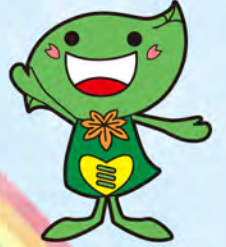
緑区キャラクター「ミドリ」