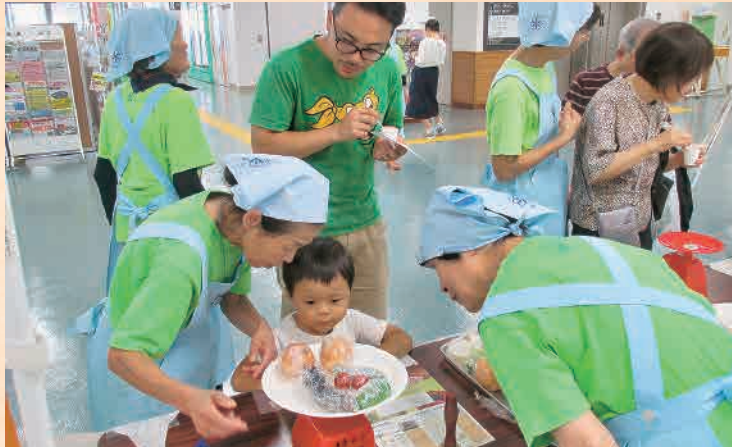
野菜キャンペーンイベント風景