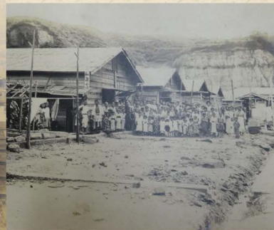
横浜市八聖殿郷土資料館所蔵