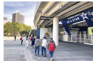
横浜公園での健康ウォーキング

地域でウォーキングイベントを開催し、運動するきっかけづくりをしています。ウォーキングに参加して一緒に心と体のリフレッシュをしませんか?