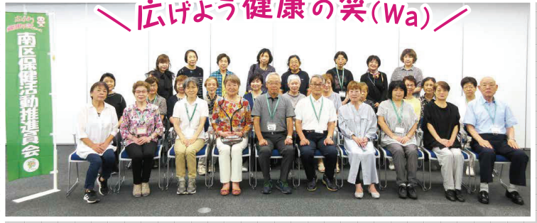
南区保健活動推進員集合写真 (各地区の会長・副会長)

自治会・町内会の推薦を受けて市長から委嘱された地域の健康づくりの推進役、横浜市の健康施策のパートナー役です。南区保健活動推進員は16地区266人で活動しています。(9月1日現在)