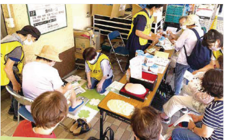
健康測定会での乳がん啓発