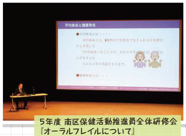
5年度 南区保健活動推進員全体研修会 [オーラルフレイルについて]