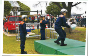
ちびっ子レンジャー体験

②体験コーナー 六ツ川大池囃子、防火衣着体験、車両展示、ちびっ子レンジャー体験(対象:5歳~6年生)、企業展示ブース[非常用トイレ、非常食について]