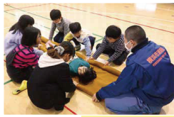
小学校での防災教室