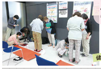
健康測定機器 取扱い研修

健康に関する知識を身に付けて活動で実践することで、自分自身の健康にもつながりました!