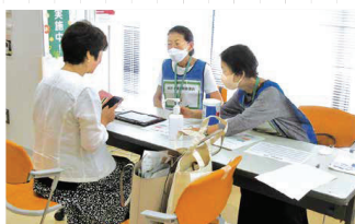
南なんデーでの健診勧奨