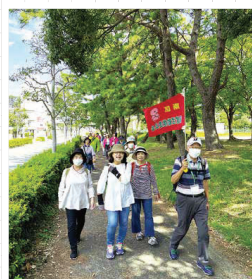
秋の健康ウォーキング