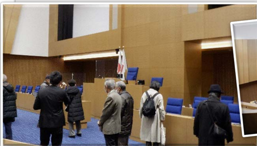
↑本会議場見学の様子 議会局職員から豆知識を交えた 案内をもらいました!