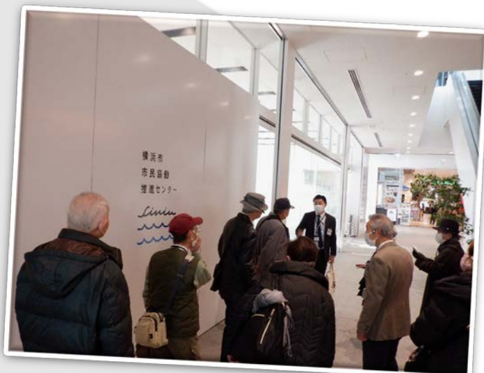
↑市庁舎1階市民協働推進センター前にて