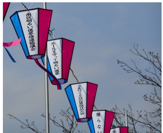
過去の桜まつりのぼんぼり