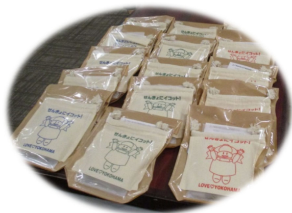
▽記念品の繰り返し使えるカイロ