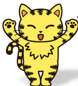
南区選挙のマスコット まねっきー