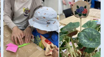
▲楽しいワークショップ