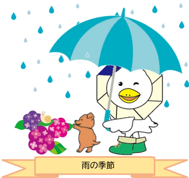
なか区民活動センターマスコット もなか