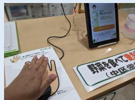
▲健康相談コーナー ベジチェック