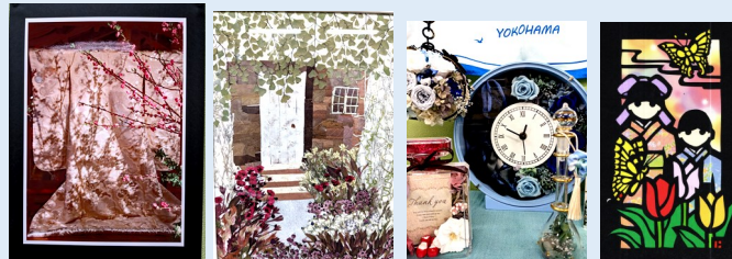
▲街の先生による作品展

ガーデンネックレス横浜2024の開催にちなんだなかく街の先生による「花と緑」 をテーマにした素敵な作品展示と楽しいワークショップに「楽しかった」の声がたく さん聞かれました。5月26日には街の先生の相談コーナーも設置され、街の先生に 登録してみたい方・街の先生を利用してみたい方へ案内が行われました。