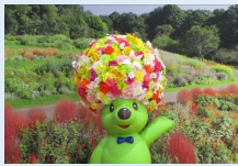
ガーデンベア撮影コーナー

令和6年5月20日(月)~5月26日(日)「花と緑」をテーマにした作品展示。 令和6年5月26日(日)10時~15時 ワークショップイベントを開催。 来場者数は、1,213名(発表、出展参加者含め1,245名)でした。