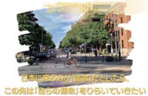
日本の空気が「自分たちの空」をひらいていきたい