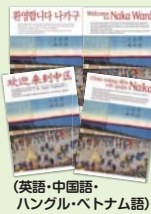
(英語・中国語・ハングル・ベトナム語)

中区に転入する外国人に対し、行政手続きや資源ごみの分別方法など、生活に必要な情報を集約したウェルカムキットを多言語で作成し、お渡ししています。