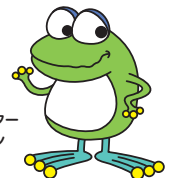
水道局 キャラクター はまビヨ