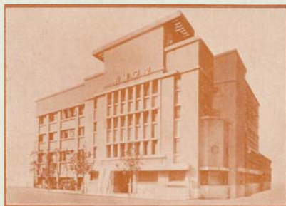
震災後の1927(昭和2)年に完成した横浜YMCA会館