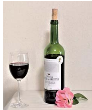
水彩画 題材イメージ