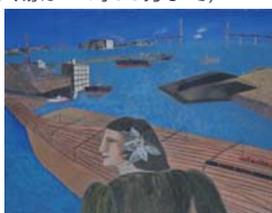
林敬二《横浜港》1988年 油彩 キャンバス 91.0×116.0cm

2021～うつつ、描かれた港と水辺 約1,300点の所蔵作品から港や海、水辺が描かれた作品を紹介しします。 📅3月5日(金)～21日(日)10時～18時(入場は17時30分まで)