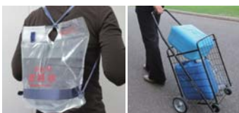
リュック型の給水袋

災害時給水所には容器の準備はありません。水は重いので、自分の体力や自宅までの道(階段の有無など)に合った容器と運搬手段を準備しましょう。