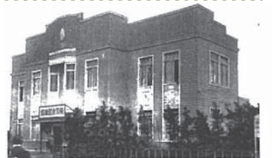
▲震災後、横浜公園内に設置された第二仮本館(「横浜市図書館概要」横浜市中央図書館所蔵)

▲震災前、横浜公園内に建設予定だった幻の図書館(横浜市図書館設計画「横浜市要覧」横浜市中央図書館所蔵)