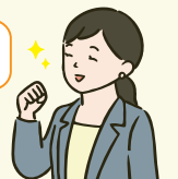
生活支援コーディネーター