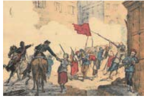
女性たちが守るブランシュ広場

今年のパリ市民による自治政権パリ・コミュン成立から150年にあたる年。これを題材にした大佛次郎の渾身の一作『パリ燃ゆ』と、当時の様子を今に伝える鮮やかな版画や資料約60点から、パリを生きた、名もなき民衆の声を浮かび上がらせてます。