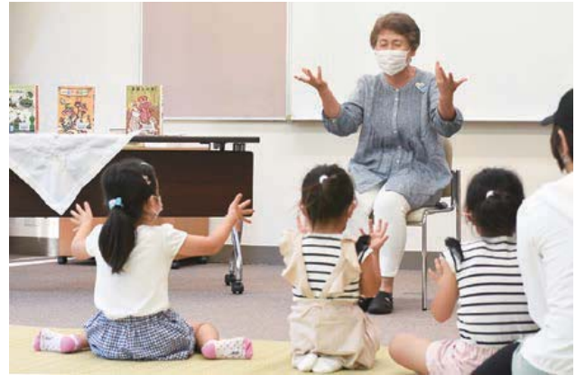
中図書館のおはなし会では、ボランティアグループの皆さんが活動しています

中図書館は、1階が児童書フロア。子どもと一緒にゆったりと本を読めます。図書館カードの登録は0歳からできます。ボランティアグループによるストーリーテリング(語り)や絵本の読み聞かせなどの楽しいおはなし会も。中図書館は子どもの読書を応援します！