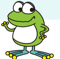
水道局キャラクター「はまピョン」

災害時給水所とは、災害などで断水したときに、誰でも飲料水を得られる場所です。日頃から、自宅近くの災害時給水所の場所を確認し、万が一に備えましょう!