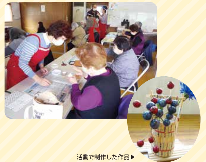
活動で制作した作品▶