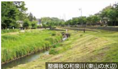
整備後の和泉川(東山の水辺)

古くから地域の人に愛されてきた和泉川。清らかな流れを見せた和泉川も、1960年頃には、周辺の開発により水の汚染が目立つようになりました。