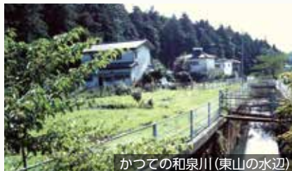
かつての和泉川(東山の水辺)