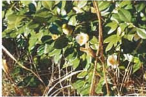
来訪者 川端 洋子