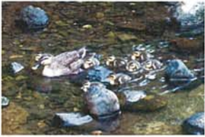
瀬谷生まれ 田端 光男