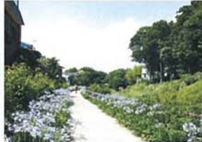
夏-アガパンサスの道 近藤 進