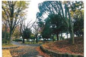
冬の始まり 森山 美江子