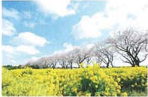
海軍道路の桜並木と菜の花畑 齋藤 均