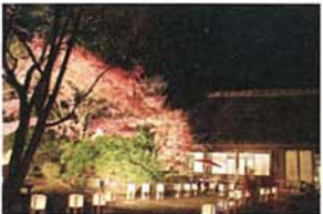
紅葉ライトアップ 本田 建一