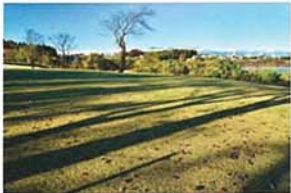
晩秋の上瀬谷風景 小島 輝夫