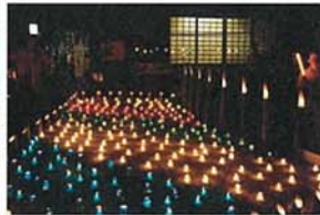
ともしび 泉沢 克太郎