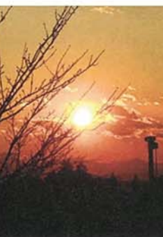
紅の空 川平 未歩