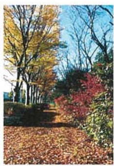
冬の始まり 森山 美江子