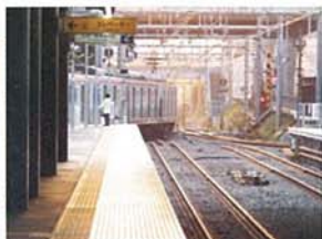
瀬谷駅4線化 始動 若林 秀則