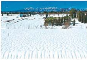
雪原と丹沢連山 小島 輝夫