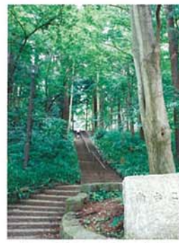
緑の世界へ誘う階段