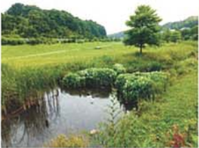
半夏生の咲くころ 田中 喜和子