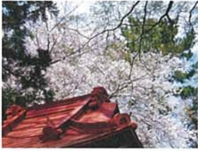
左馬神社・鐘撞堂と桜 田中 信一