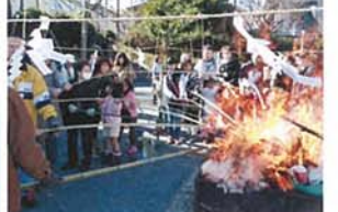
どんど焼き 松岡 文和