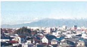
三ツ境から富士を望む タナカ