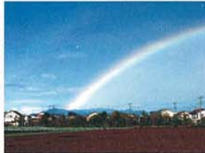
丹沢山塊と虹 田端 光男