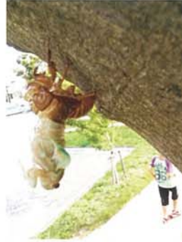
出られたぞ〜 東 七男