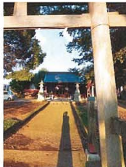
諏訪社 詣 若林 秀則