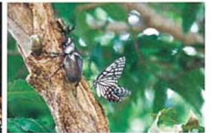
カブトとアカボシコマダラのコラボ 須田 和明