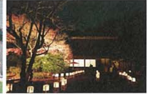
長屋門 秋の夜 川端 淳一