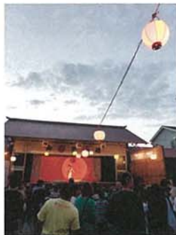
夏祭り 松岡 文和