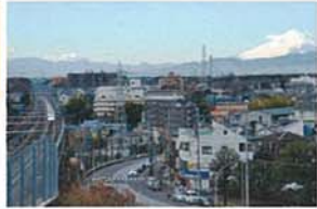
我が街阿久和 後久 二郎