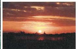
黎明・上瀬谷米軍基地 奈良部 岩次