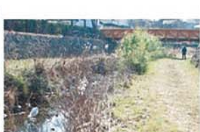
コサギと東山ふれあい橋