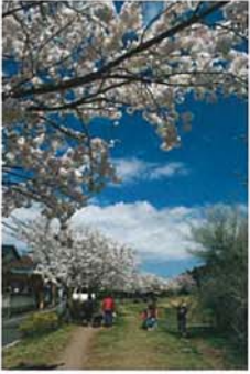
和泉川の桜 相澤 詔二