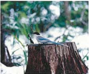
雪の日の尾長鳥 山崎 忠重