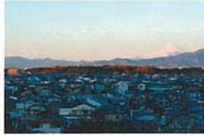
夜明けの阿久和 後久 二郎