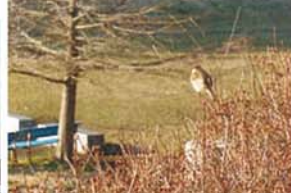
雀の背中 なんでも

瀬谷の魅力風景写真展 平成27年3月10日～3月14日開催 写真の無断転載を禁じます。 瀬谷区企画調整係 電話045-367-5632 FAX045-365-1170 se-photo@city.yokohama.jp