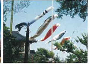
背比べ 東 七男