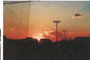
黄金包 河上 美紗