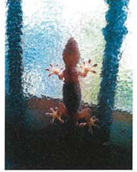
我が家の居候 東 七男