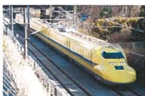
瀬谷区を通過するドクターイエロー 泉沢 克太郎