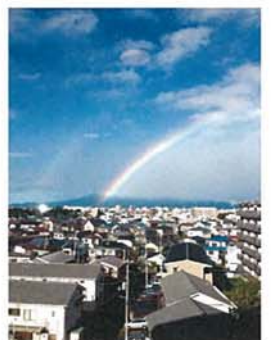
未来の懸け橋 プロジェクト