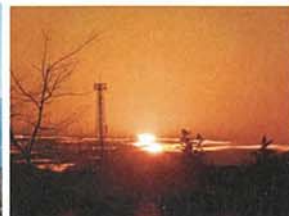
細谷戸の夕焼け 杉本 彰