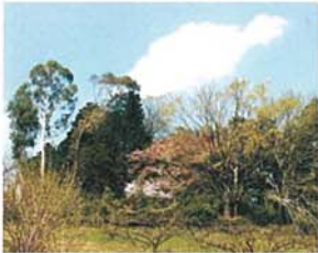
森 窪添 康洋