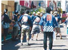
祭り バナナチョコ