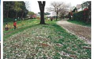
白い散歩道 深井澤 彰一