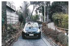
愛車 正橋 ハルミ