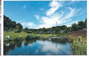
癒しの空間 (宮沢遊水池) 奈良部 岩次