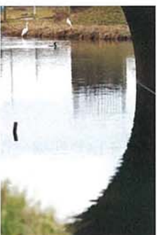
初対面(ダイサギ、コサギ、カワウ) 諸橋 茂夫