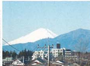
三ツ境から望む富士 杉本 彰