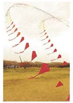
天まで届け! 浅田 祐香梨