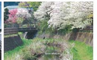
花の小径 諸橋 茂夫