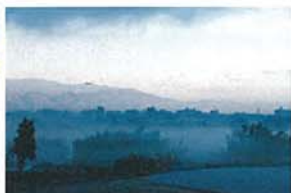
古戦場の朝 中村 多加夫