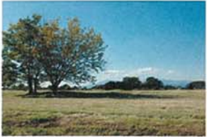
返還間近か米軍上瀬谷通信施設付近 松本 光雄