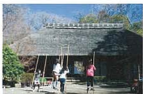
古民家であそぶ 相澤 詔二