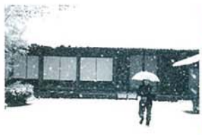
どか雪の朝 鈴木 進