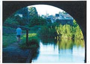
早朝散歩 加納 正晴