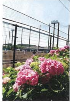
瀬谷本郷公園のアジサイ 佐藤 常隆