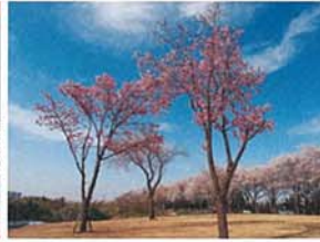
お花見の三姉妹 魚崎 一郎