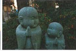
ほほえみ せやくま