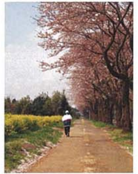
桜並木を走り抜けて aona