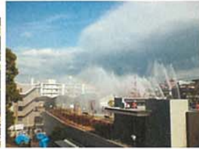
出初式一斉放水 川端 洋子