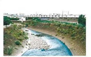
境川を渡る相模鉄道線 萩原 昭雄