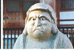
まなざし せやくま