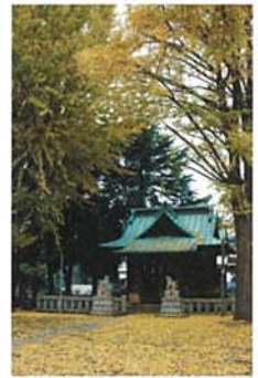
八幡神社の紅葉したイチョウ・落葉 松本 光雄