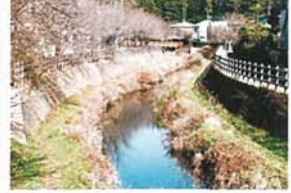
和泉川東山の水辺 萩原 昭雄