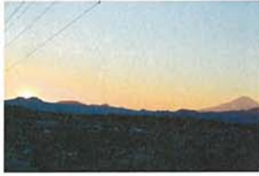
小金山夕景 植木 茂雄