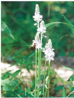
野草の花 ツルボ 熊谷 仁