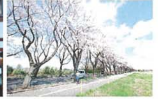
海軍道路の桜並木 齋藤 均