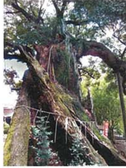
スタジイの古木 田中 信一