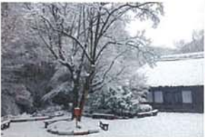
雪に煙る長屋門 川端 洋子