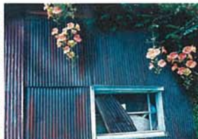
廃倉庫とノウゼンカヅラ 田中 信一