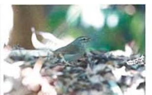
春を待つウグイス 泉沢 克太郎