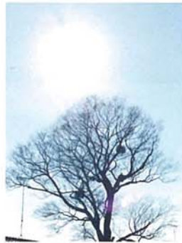
SANCTUS 弘井 紀美慧