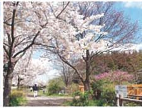
桜満開 加納 正晴