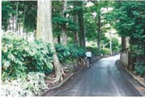
古道 三浦 良光