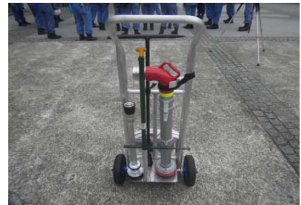
スタンドパイプ式初期消火器具