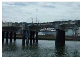
南本牧はま道路の損傷（中区）