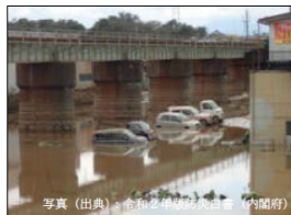
郡山市の浸水被害（福岡県）