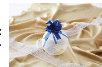
キャンサーバルーン

医療を身近に感じていただく医療広報プロジェクトの一環として、 風船を用いた乳がんセルフチェックのための啓発グッズ「キャンサーバルーン」を作成し、イベントで配布しました。