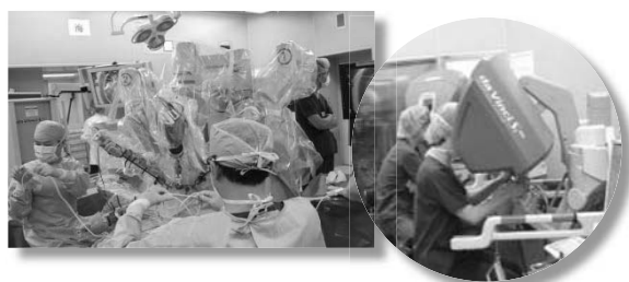
手術支援ロボット「ダ・ヴィンチ」操作風景

横浜市立大学附属病院では手術支援ロボット「ダ・ヴィンチ」によるロボット支援型手術に関して、既に保険収載されていた前立腺がん及び腎がんのほか、 臨床研究として実施していた胃がんと直腸がんについて、保険適用