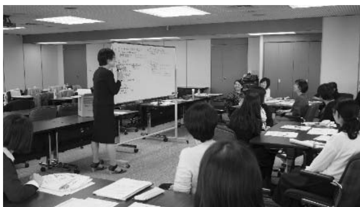
医療従事者向け研修（11月）