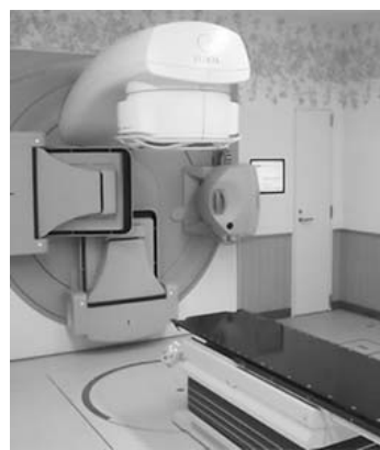
IMRTが実施できる 放射線治療装置（リニアック）

また、 国立がん研究センター中央病院を中核病院として連携する「がんゲノム医療連携病院」の指定を目指し、取組を進めました。（平成31年4月指定）