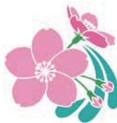
戸塚区の花「桜」デザインマーク