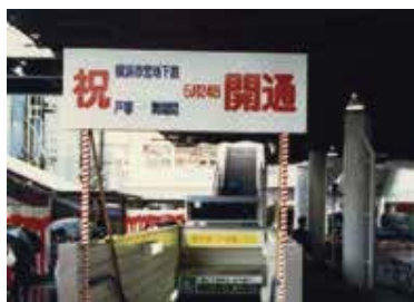
地下鉄戸塚駅開業