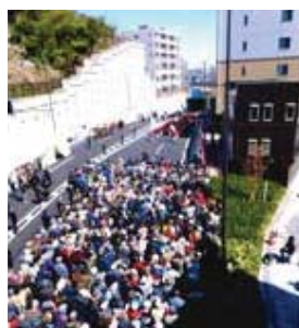
アンダーパス開通