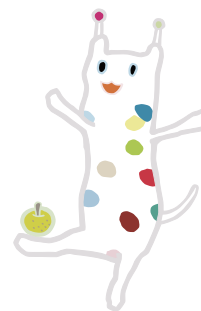
戸塚区のマスコット「ウナシー」