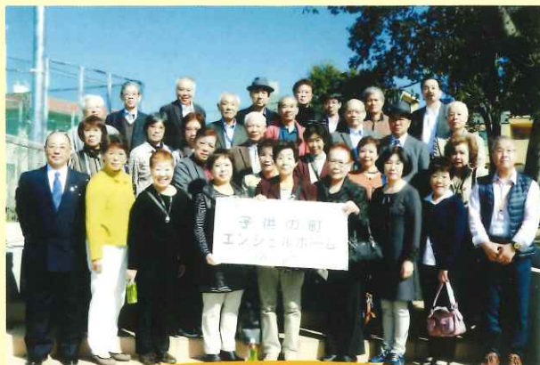
研修旅行に参加された方々

子どもへの虐待がクローズアップされる中、民生委員・児童委員として地域へのどのような関わりが必要となるか、大いに学ぶことができた見学会となりました。