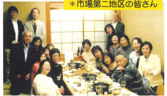
*市場第二地区の皆さん