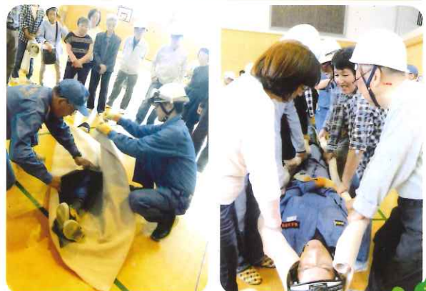
* 毛布で担架作りと搬送訓練