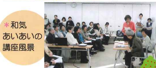
* 和気 あいあいの 講座風景