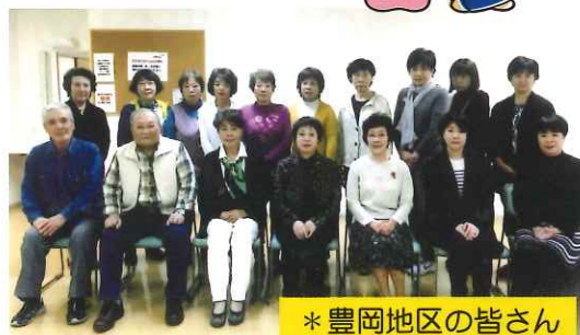
* 豊岡地区の皆さん