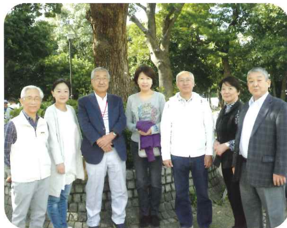
* 潮田西部地区の皆さん