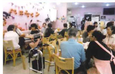
* 豊岡 ふらっと カフェ