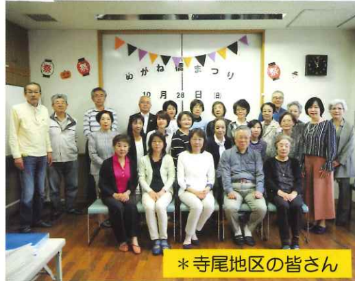
* 寺尾地区の皆さん

寺尾地区は3つの山にまたがる坂道の多い地域で、7つの自治会町内会から構成されています（東台自治会・中部会・東寺尾北部町内会・ひびき町会・別所自治会・北寺尾東部自治会・獅子ヶ谷自治会）。地区民児協は総勢27名。超ベテラン～新人まで、様々な経験を活かしてチームワークで活動中！！