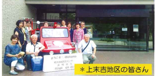
* 上末吉地区の皆さん