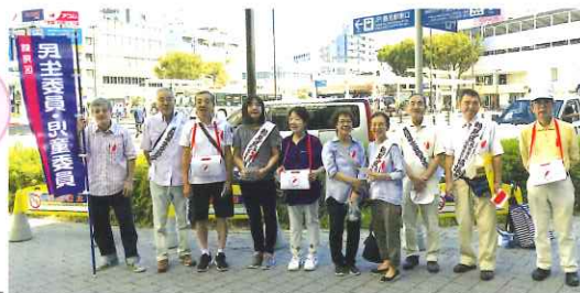
*潮見橋地区の皆さん